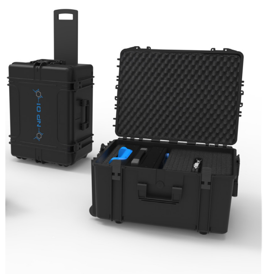
optionaler, robuster, Transportkoffer