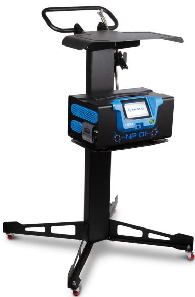
optionaler Fahrwagen NP 01