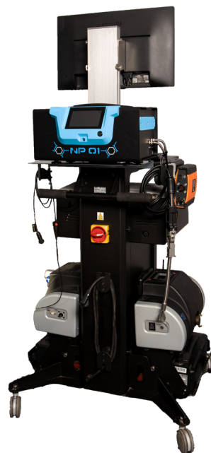
NP 01 in Kombination mit EcoStation mit Gas- und/oder Opabox Autopower Abgasmessgeräten